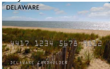
Tarjeta SNAP EBT existente